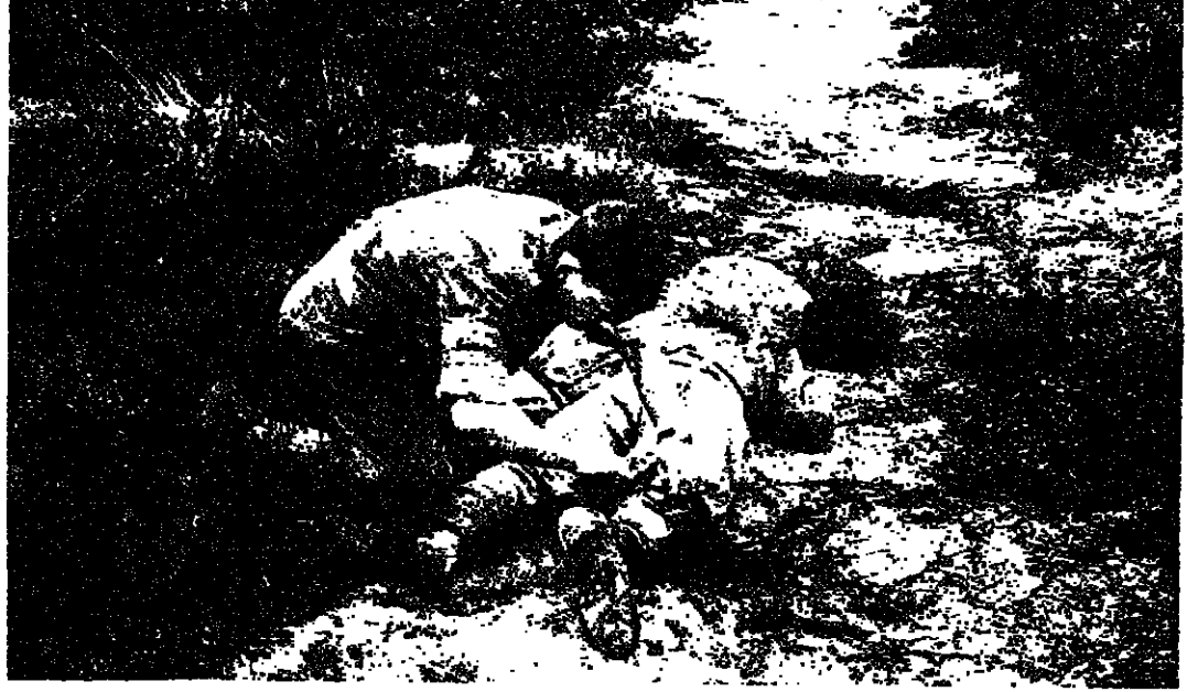
حياة الانسان هي المستهفة اولا واخيرا

ينتظر ان يتجاوز الانفاق العسكري في العالم هذا العام ، ما يعادل خمسمائة الف مليون دولار . اي زيادة لا تقل عن عشرة في المئة من مجموع النفقات المقترحة عن العام الماضي وهو ٦٠ الف مليون دولار . كما يتوقع ان يصل مستوى الانفاق على مستلزمات الدفاع في العالم الى ٦٠٠ الف مليون دولار خلال